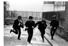
A Hard Day's Night