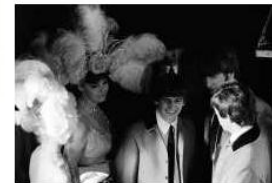
With chorus girls during filming for "A Hard Day's Night"