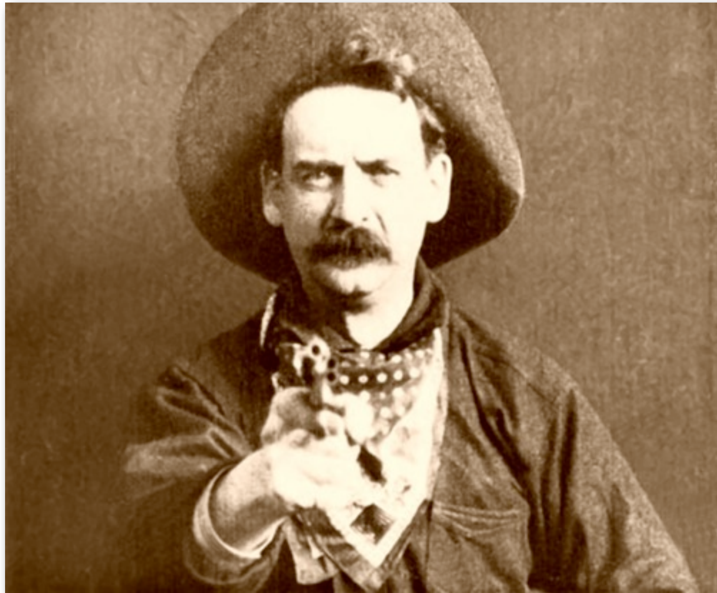
1903 The Great Train Robbery

„Man braucht doch nur einen hell gekleideten Guten, einen dunkel gekleideten Bösen und eine Frau dazwischen. Und wenn es langweilig wird, gibt es noch Pferde und ein paar Revolver, und das müsste eigentlich genügen für einen Western.“ (Joseph Kane)