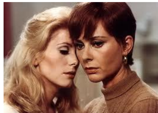
Geneviève Page als Madam Anais