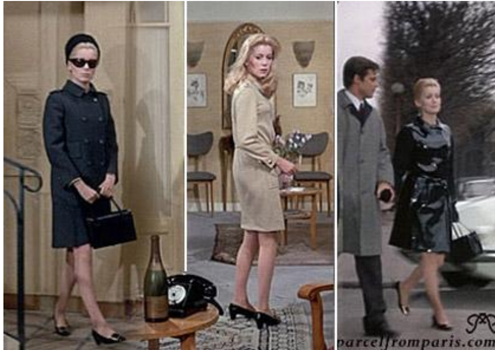
Kostüme von Yves Saint Laurent