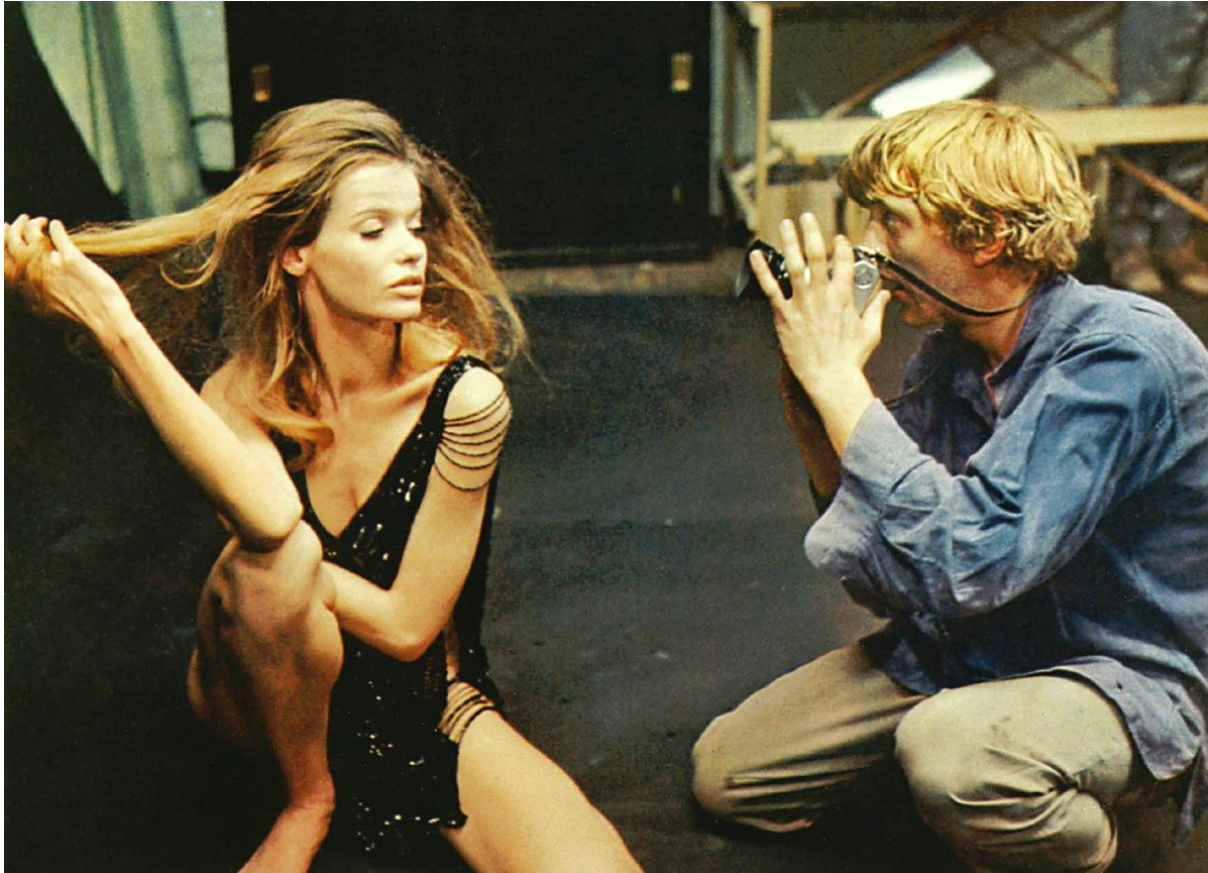
Veruschka von Lehndorff