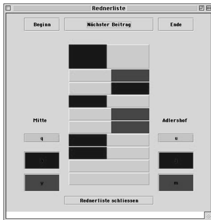
Abbildung 3: Verteilte Rednerliste

send war oder es kam bei zwei Tutoren zu zwei geteilten Diskussionen. Ein gemeinsames Gespräch scheiterte regelmäßig (a) an der Latenzzeit bei der Übertragung und (b) an der Unmöglichkeit, die Beiträge zu koordinieren. Aus diesem Grund entwickelten wir ein Programm, das eine gemeinsame Rednerliste an den beiden Standorten Adlershof