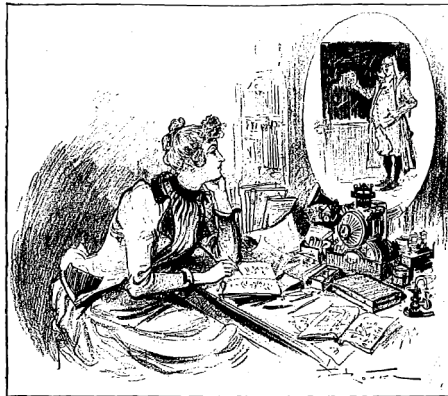
LES COURS PAR TÉLÉPHONOSCOPE.