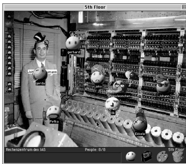
Abbildung 4: Beispielprojekt im 5 th Floor.

Der anderer Versuch einer weniger reglementierten horizontalen Kommunikation bestand in der Einrichtung visueller Chaträume mit dem grafischen MUD (Multi User Domain) Palace (thepalace.com). Jeder Teilnehmer bekam die Aufgabe, einen Raum als Semesterprojekt thematisch und inhaltlich gestalten, z.B. »John von Neumann und die ENIAC« (s. Abb. 4). Während der Übung wurden die einzelnen Räume von ihren Verantwortlichen präsentiert, während die übrigen Teilnehmer sich im Raum einloggen und über Details austauschen konnten. Die Avata-